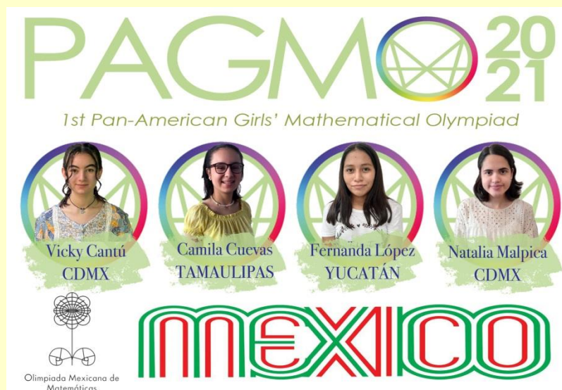
Equipo mexicano PAGMO 2021